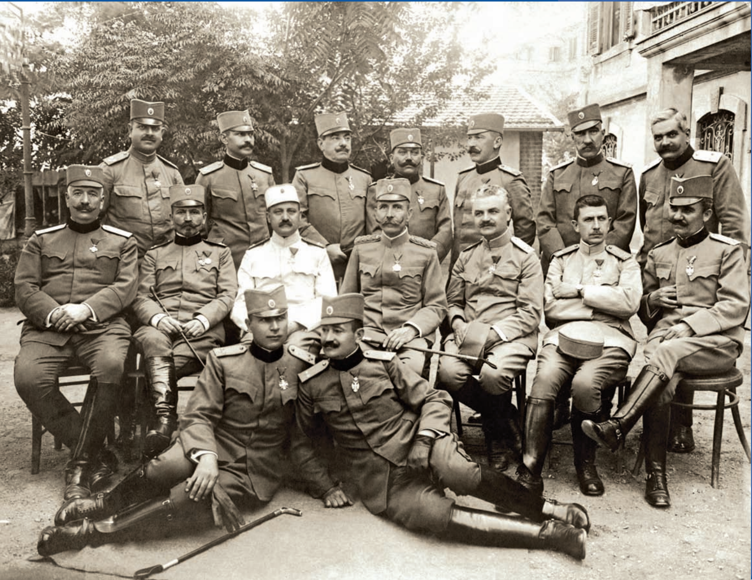
Генерал Петар Бојовић са официцима Штаба Врховне команде

Церске битке притекла у помоћ Другој армији, преотела Шабац и протерала Аустријанце преко Саве у Срем. Том приликом генерал Петар Бојовић је на првој борбеној линији рањен. „За показану и осведочену храброст 21. августа 1914, при нападу на Шабац“ одликован је Златном медаљом за храброст.