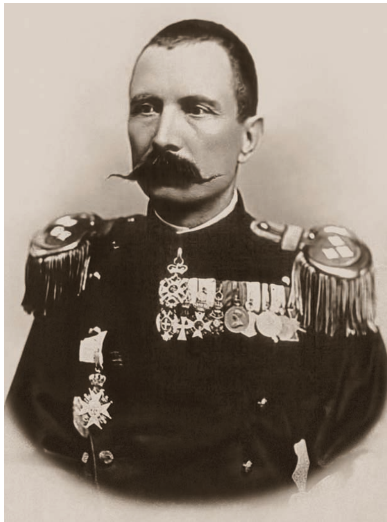
Пуковник Пеџар Бојовић, 1901–1902. године

Потпуковник Бојовић оцењен је као: „Спреман и образован официр. Има тактичке подобности. Има иницијативу у раду и ову код млађих развија. Има добар такт у командовању и ужива у команди љубав и добар глас. Ради на развијању моралних особина. Потпуно спреман