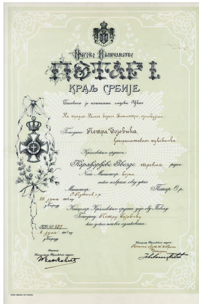
Повеља за Орден Карађорђеове звезде шрећег реда

нио ситуацију и прешао у противофанзиву у правом тренутку. Треба нагласити и да су се сви аустроугарски команданти, од нивоа батаљона до нивоа армије, у тренутку српског противудара налазили у тек заузетом Београду, где су примали одликовања.