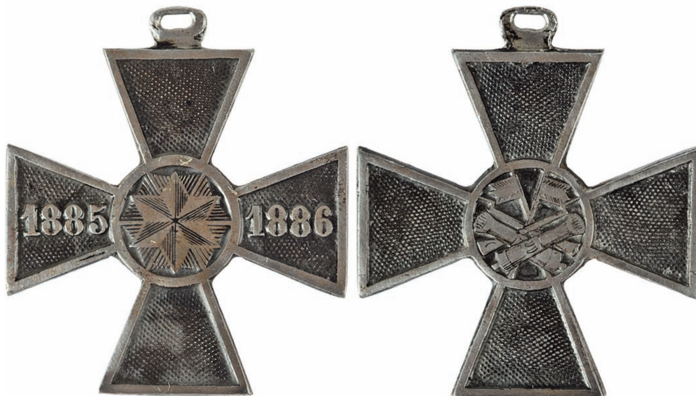
Споменца раја 1885/86. године