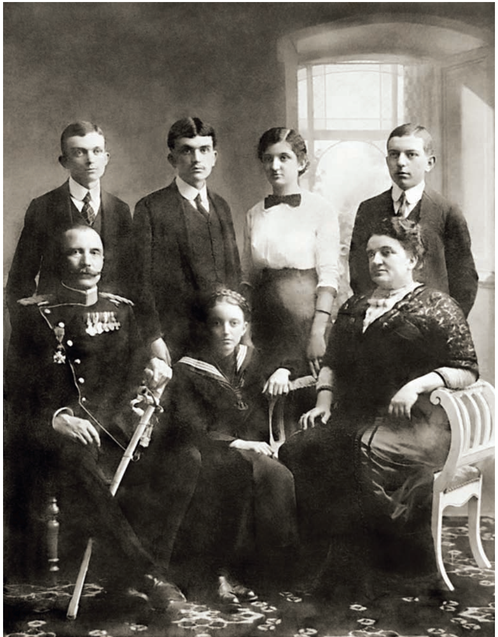
Породица генерала Пејтра Бојовића, 1913–1914. године