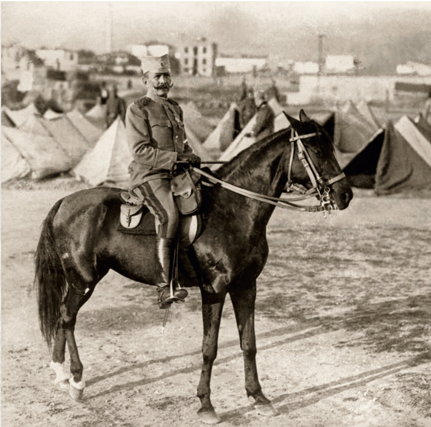
Генерал Пејшар Бојовић на коњу, 1916. године