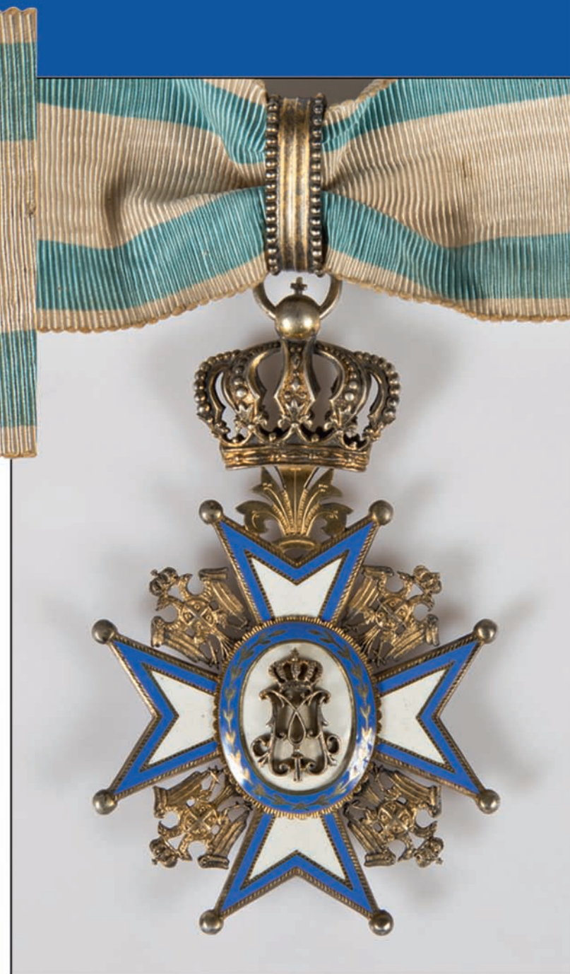
Орден Светог Саве првег реда

Некада богату збирку службеног одела данас чине само поједини делови мале и велике војводске одеће, једна блуза и шињел. И тако окрњена, она представља јединствену целину, каква није сачувана ни од једног другог војводе. Велики војводски