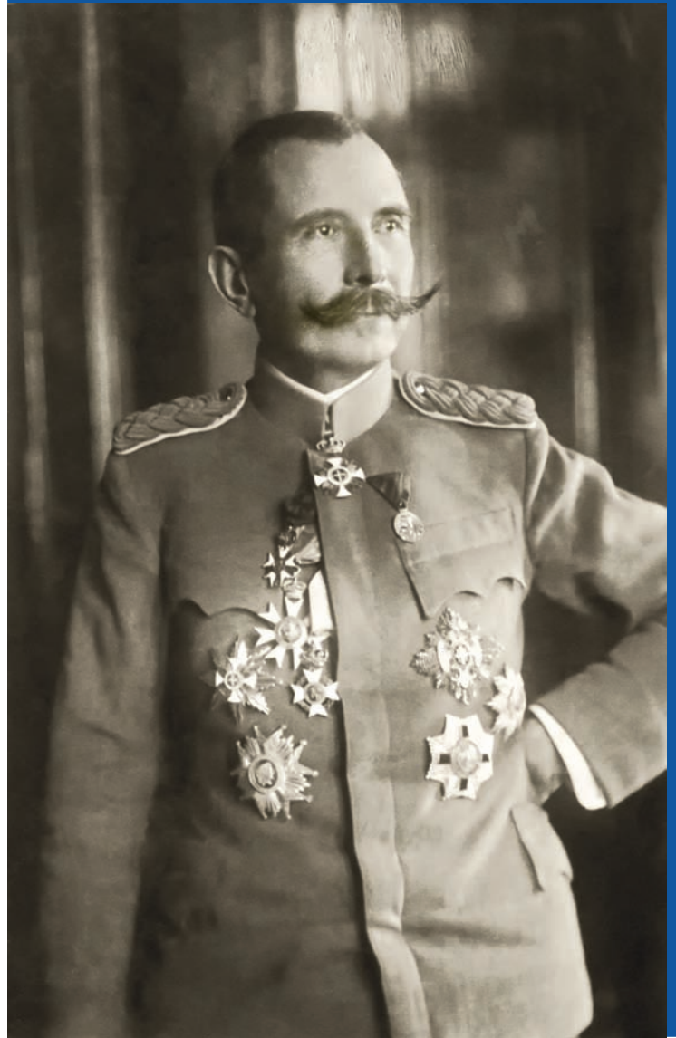
Генерал Петар Бојовић, 1918. године

У Првом балканском рату (1912–1913) био је начелник Штаба Прве армије, којом је командовао престолонаследник Александар Карађорђевић. Прва армија однела је велике победе над турском Вардарском армијом у биткама код Куманова, Битоља и боју код Алинаца, што је имало пресудан значај за даљи ток рата. За заслуге на бојном пољу унапређен је у чин генерала. На мировним преговорима у Лондону, као „један од наших најбољих стручњака“, био је војни експерт српске владе. Крајем фебруара 1913. године постављен је за ко-