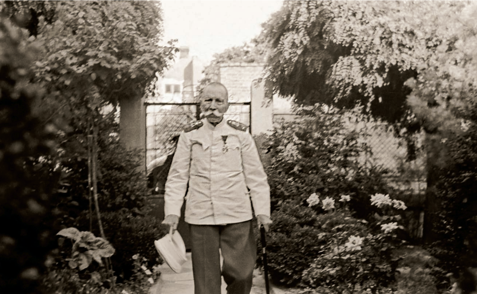
Војвода Пејар Бојовић у шејњи, око 1940. године