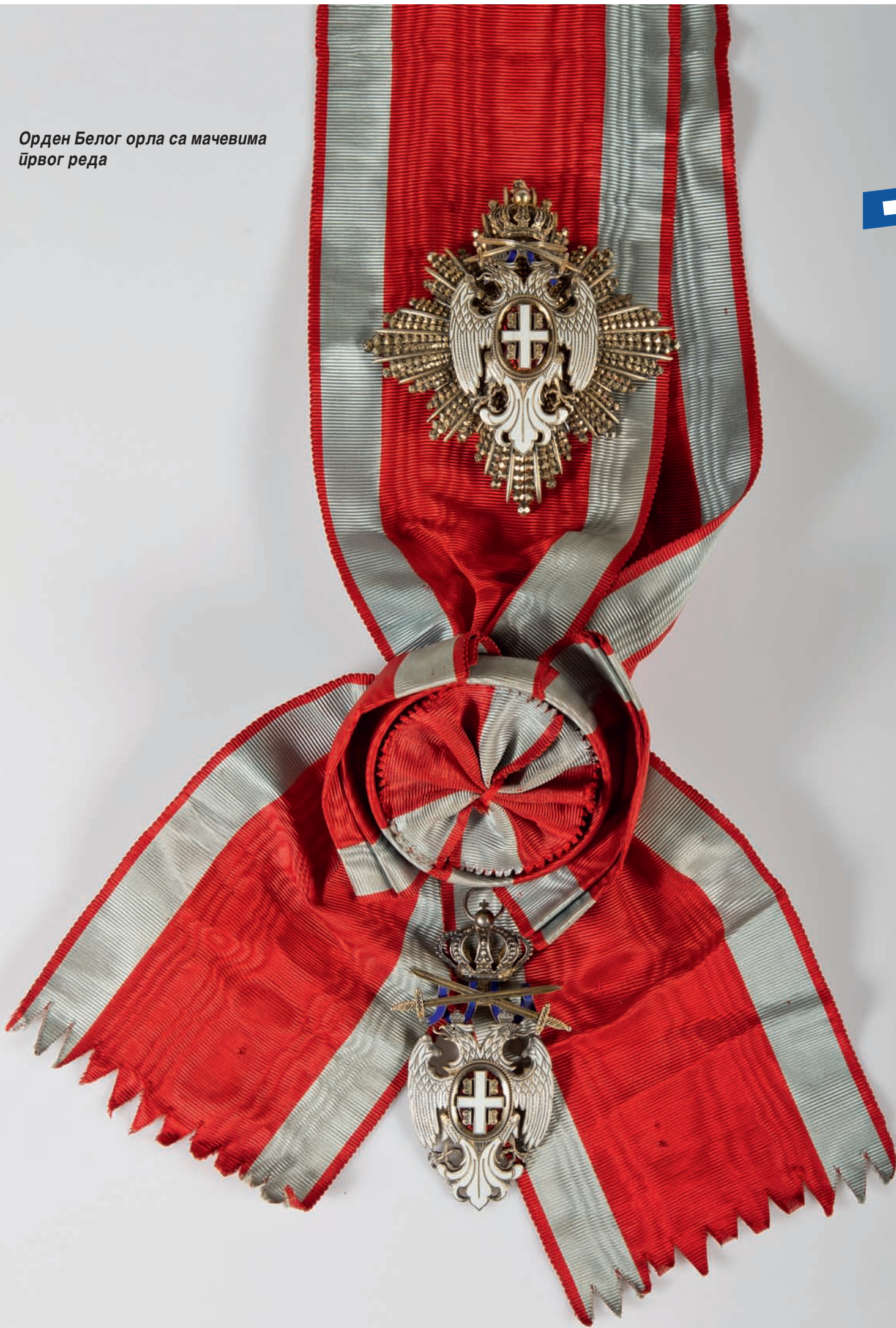
Орден Белог орла са мачевима првог реда