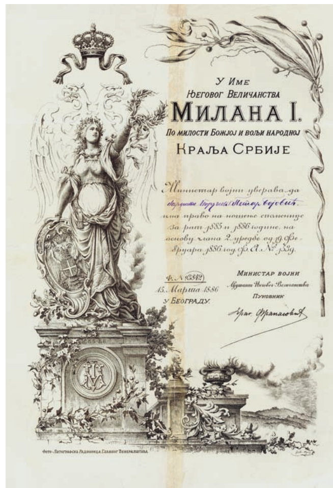
Уверење за Споменцу раја 1885/86. године