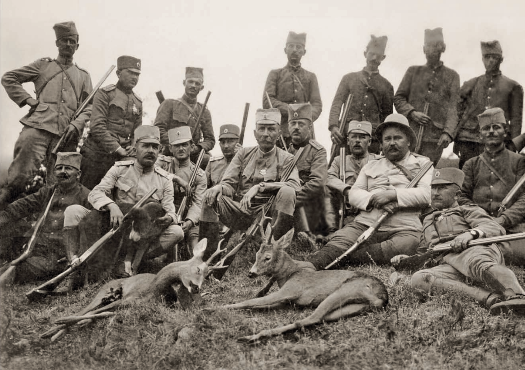
Генерал Пејтар Бојовић са ловцима на Солунском фронту, 1918. године

У рововском периоду рата, Бојовић је извршио другу реорганизацију српске војске крајем марта 1917. године, када је због малог броја војника престала да постоји Трећа армија. За команданта Прве армије постављен је јула 1918. године, после сукоба са француским генералом Гијомом око ширине фронта додељеног српској војсци. Приликом одласка с дужности начелника Штаба Врховне команде за заслуге у рату одликован је Орденом Карађорђевог звезде са мачевима II реда. У последњој ратној години примио је италијански Орден Светог Мауриција и Светог Лазара I реда и грчки Орден Светог Спаситеља II реда.